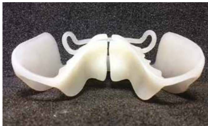
Figg. 1 e 2 Equilibratore Multifunzionale Flessibile®