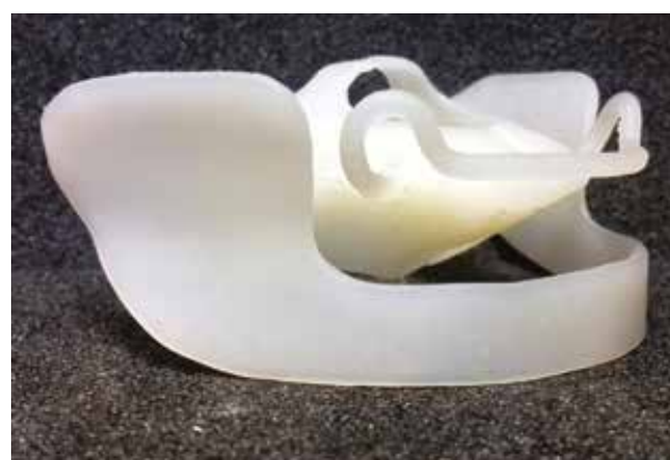
Figg. da 15 a 17 Il dispositivo è pronto per essere inviato al clinico

Fatto questo si isola il negativo del dispositivo con un isolante resistente alle alte temperature e si richiude la muffola. Ora bisogna preparare la cartuccia con l'F.J.P. da iniettare, la quantità varia in base alla grandezza del dispositivo e alla grandezza e lunghezza dei perni di iniezione; si consiglia comunque di eccedere sempre per garantire la giusta spin-