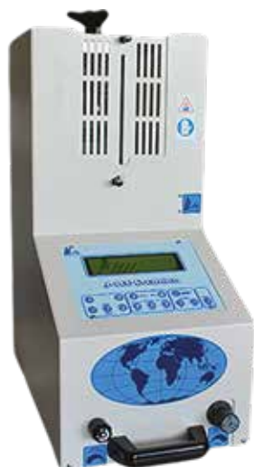
Fig. 14 J100 Evolution by Pressing Dental