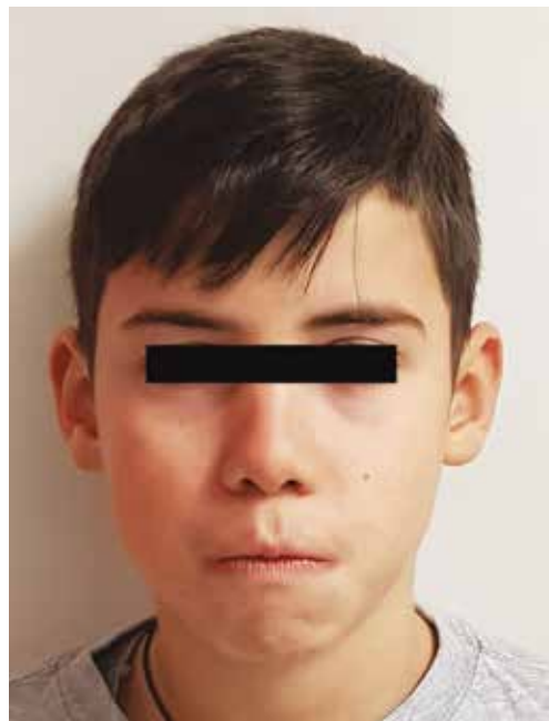
Fig. 10 Vista frontale extraorale con apparecchio in situ