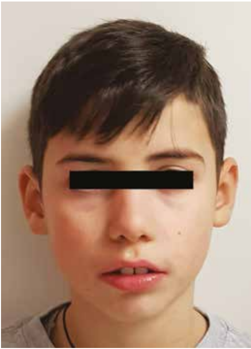
Fig. 5 Vista frontale extra-orale senza apparecchio