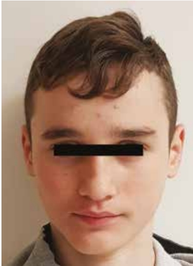
Fig. 11 Paziente senza dispositivo