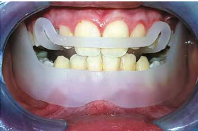
Fig. 13 Visione intraorale

me 2-3 settimane solo per 2-3 h di giorno avendo cura che il paziente quando è con l'apparecchio stia a labbra chiuse; per questo motivo vengono adeguatamente istruiti i genitori. Trascorso tale periodo di "allenamento" si comincia l'applicazione notturna, chiedendo ai genitori di verificare e di appuntare su tavola di controllo se il paziente dorme con le labbra aperte o chiuse, se russa o meno e se è presente saliva al mattino sul cuscino. Se dovessero presentarsi con frequenza questi riscontri è opportuno prolungare l'applicazione diurna. Un segno importante che il paziente è pronto per l'applicazione notturna efficace (a labbra chiuse) è il passaggio da una condizione di fatica a stare a labbra chiuse manifestata dalla comparsa sul mento dell'aspetto "a pallina da golf" per la contrazione del muscolo quadrato, ad una condizione di postura a labbra chiuse mantenuta in modo naturale senza contrazioni forzose della muscolatura periorale (Figg. da 11 a 13).