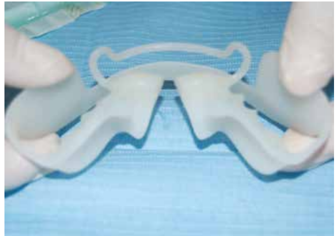
Fig. 4 Elasticità del dispositivo

razione orale, incompetenza labiale, sindromi da apnee notturne (osas). Tali situazioni, infatti, accompagnano e sostengono le malocclusioni in un circolo vizioso che si auto incrementa, ovvero il peggioramento della funzione si accompagna sempre al peggioramento dello sviluppo dento facciale e dell'occlusione. Con l'utilizzo dell'equilibratore, ancora meglio se associato a terapia miofunzionale e a logopedia, noi andiamo ad interrompere tale circolo vizioso e lo trasformiamo in un circuito virtuoso in cui il paziente sta meglio perché deglutisce meglio, si alimenta meglio, respira e dorme meglio e parallelamente i suoi denti si allineano e le arcate mascellare e mandibolare vanno a svilupparsi e a combaciare in maniera corretta ed armonica.