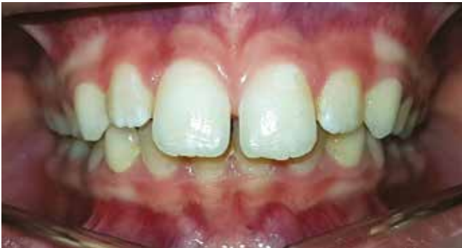
Fig. 7 Vista intraorale frontale senza apparecchio