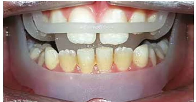
Fig. 8 Vista intraorale frontale con apparecchio in situ